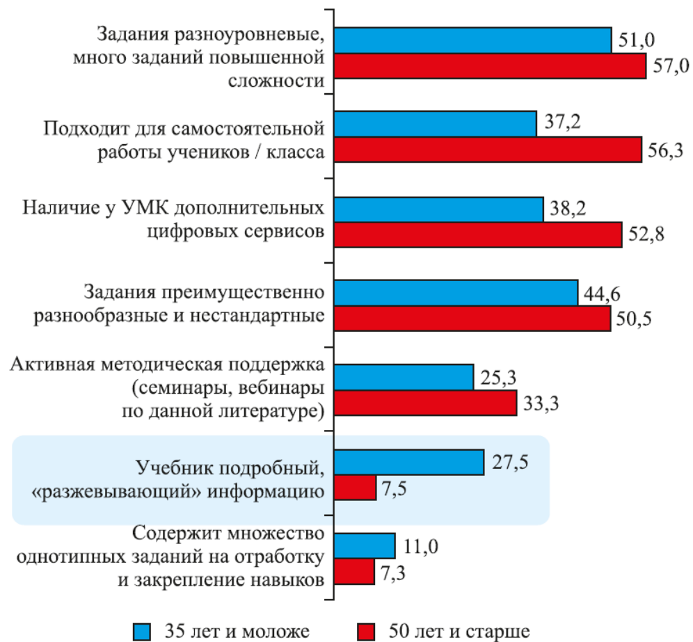
Рис. 37. Различия между поколениями учителей в критериях выбора учебника, %

Что для вас наиболее важно при выборе учебника?